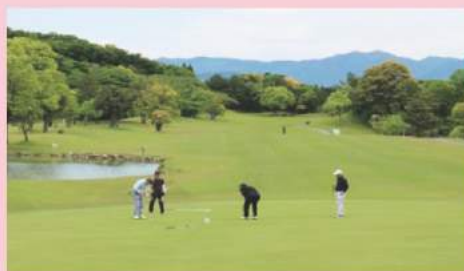
〈2018年 春期ゴルフコンペ〉