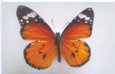
《御浜町阿田和産 カバマダラ》

50歳を過ぎてから単身赴任で紀南へ。紀南支部にはサークルで昆虫部会があった。多くの仲間と出会いがあり、採集ができた。キナンウラナミアカシジミ、カバマダラ等「紀南を彩るチョウ」との出会いがあり、標本箱に収まっている。