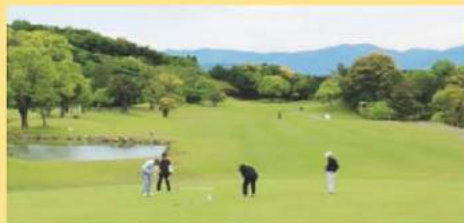
〈2017年 春期ゴルフコンペ〉