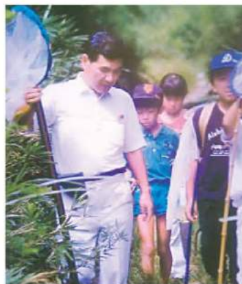
《小学生との採集会》

今の私の目的はチョウ採りと人との出会いがハーフハーフだ。地域の方との新しい出会いを求めて、これからも津偕楽公園へ出かける。