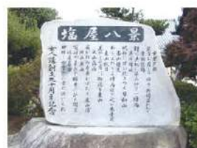
塩屋八景碑(本照寺)

稲生地区は、西に鈴鹿サーキットがあります。塩屋は稲生地区の東にあたり、農業を生業とする静かな地域でしたが、近年は新しい住宅地が急増し、約750世帯あります。