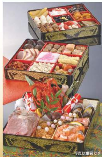
写真はイメージです