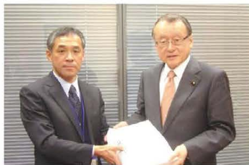
中川正春衆議院議員に署名を手渡す 写真は27年度のものです

私たちは社会保障の充実を心から願っており、将来的に国民が安心して暮らすための多くの重要施策について積極的に進めていく必要があると考えます。