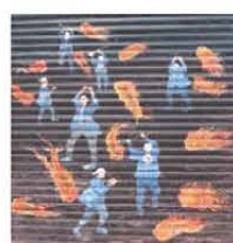
屋形倉庫の左端の絵

今年は、10月21日(土)に行われます。3年に一度行われる一大イベントである鴨神社の大祭『屋奉松明』に是非足をお運びください。