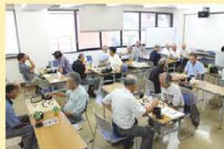
<昨年度の対局の様子>