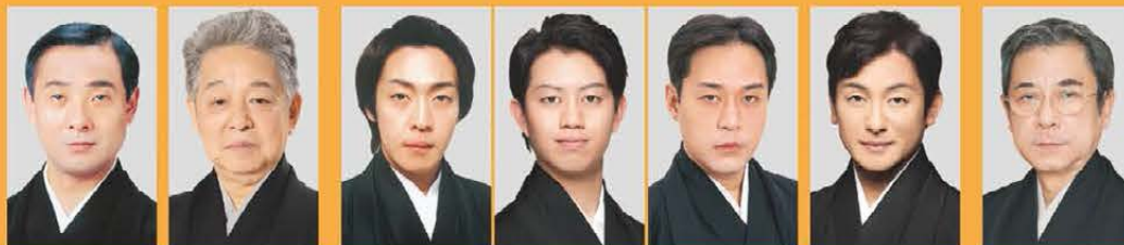
中村魁春 中村東蔵 中村亀鶴 中村壺太郎 中村松江 片岡愛之助 中村梅玉

錦秋を彩る恒例の御園座歌舞伎「錦秋名古屋 顔見世」。今年も金山(5周年)で、豪華出演者によって大歌舞伎の魅力を堪能できる舞台となります。どうぞお楽しみください。