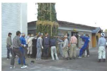
氏子総がかりで松明作り