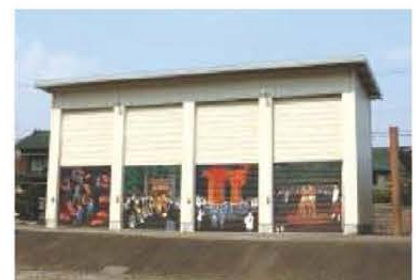
屋形倉庫の大祭図4枚 (いなべ総合学園美術部制作)