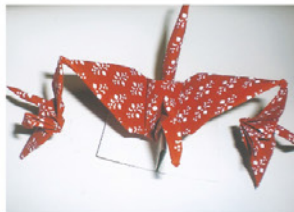
◀ 花見車(はなみぐるま) ▶

年7月の空襲で義道に関するものは焼失してしまい、地元の桑名でも知られていませんでした。東京で発見され、桑名へ知らされ、公民館等で講習会が開かれ、世にも珍しい折鶴が桑名で生まれたことから、昭和51年(1976)に「桑名市無形文化財」として指定されました。