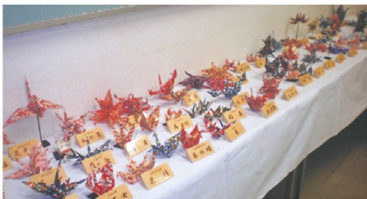
◀ 49種類の折り鶴 ▶

口と口がつながっている「拾餌(えひろい)」の初歩のものから、羽と羽を合わせて折り込んだ「妹背山(いもせやま)」、大きい鶴を中心に羽と羽、口と尾が複雑に97羽つながった「百鶴(ひゃっかく)」など49種類の素晴らしい折り方があり、一羽ずつ折り上げていくものから、折り癖を付けてから同時に仕上げていくものもあります。