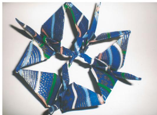
◀ 風車(かざぐるま) ▶

「桑名の千羽鶴」49種類が「桑名市無形文化財」に指定されたからには、桑名市民として、誇りと自信をもって、全国、世界へと発信していくことが必要と感じ、老後の楽しみだけでなく、若い世代(子どもたち)に興味、関心を持って、身につけて、後世へ伝え残して行ってほしいと願っています。