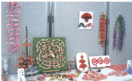
◀ 中央の緑色の鶴が、「百鶴(ひゃっかく)」 ▶

一般に千羽鶴といえば「一羽の折り鶴を糸でたくさんつないだもの」とされています。ところが「桑名の千羽鶴」は、糸でつないだものではなく、日本の伝統文化「折り紙」の不思議さを優美に数羽の連なった鶴を一枚の和紙にいくつもの切り込みを入れ、胴体のどこかが必ずつながり、2羽から最高97羽(百鶴 ひゃっかく)まで鶴を折りつなげたものです。