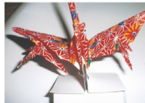
◀ 熊谷(くまがえ) ▶