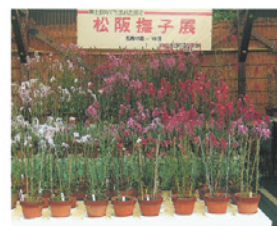
展示会の様子(松阪撫子)

最近、「三珍花」の発祥地の町の「街づくり協議会」と市の関係機関も加わり、発祥地に記念碑を建立する他、DVDと絵葉書を制作し、「松阪三珍花」の名を全国に広めようと、我々の保存活動を応援して戴くことになり、我々も一層保存活動に傾注しなければと考えている。