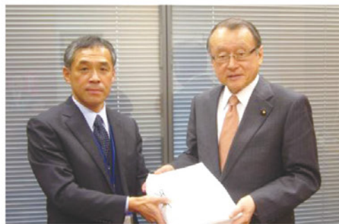
中川正春衆議院議員に署名を手渡す

私たちは社会保障の充実を心から願っており、将来的に国民が安心して暮らすための多くの重要な課題について慎重に検討を深めていく必要があると考えます。