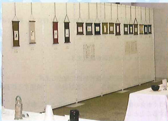
三重県教育文化会館の新別館竣工記念文化祭 「絵てがみ(墨彩)講座」コーナーで