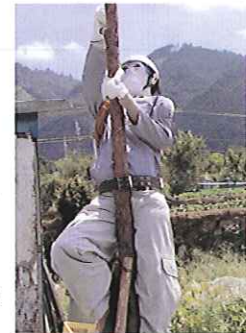
枝打ちをするかかし

活性化のためには、月1回の「朝飯会」を開催し、盛り上がりをはかることも話し合われている。