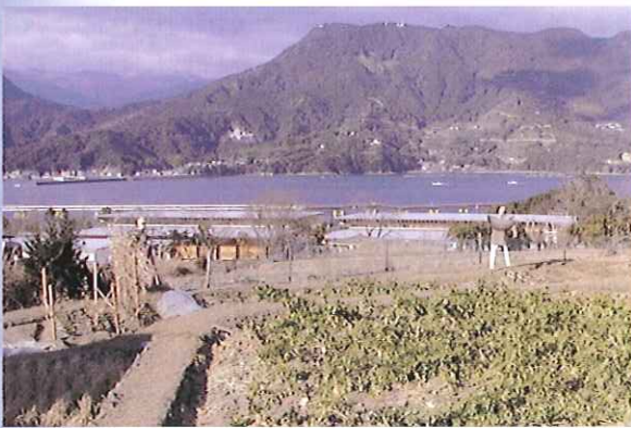
尾鷲が一望できる向井の棚田

市役所の水産農林課や県事務所の農政課と連絡を取り活動を始めてみると、両者とも考えていた以上に積極的に応援してくれた。また、地方新聞だけでなく全国紙でも活動が報告され、市民に広く情報を提供することができた。家庭菜園を楽しむ人々も増え、20組ぐらいが休耕田を耕し楽しんでいる。