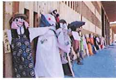
かかしコンテスト