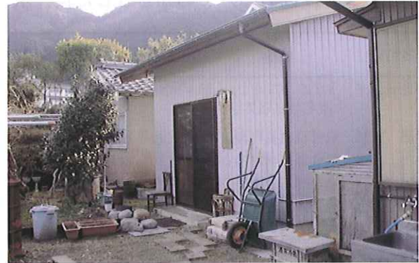
農事生産塾「向井の里」奥地漬物工房

尾鷲商工会議所からは、深層水を使用した漬け物作りを依頼され、「しお学舎」の塩を使った大根の新漬け「特選大ちゃん漬け」を開発した。試食会で好評を得て700パックの製品を1ヶ月で完売することができた。