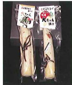
「しお学舎の塩」を使用した 「特選大ちゃん漬け」 「大ちゃん漬け」

今年の元旦には、「向井の棚田で初日の出を祝う会」を実施したところ、地区外からの参加者も多く、用意した「ぜんざい・雑煮」が足りない有様であった。向井の里からも漬け物を、また地区の魚屋からはサンマのひもが提供され御神酒のつまみに好評を得ることができた。