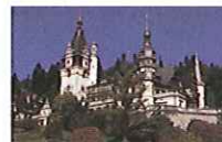
ドイツルネッサンス様式のペレシュ城

旅の企画 お申し込みは 三重県学校厚生会へ 〒514-0003 津市桜橋2丁目142番地 三重県教育文化会館 TEL 059-221-3630 FAX 059-221-3556 旅の取扱は 厚生会ツーリスト