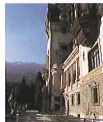
ルーマニアを代表する美しい城