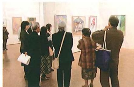
日本画の講評に聞き入る