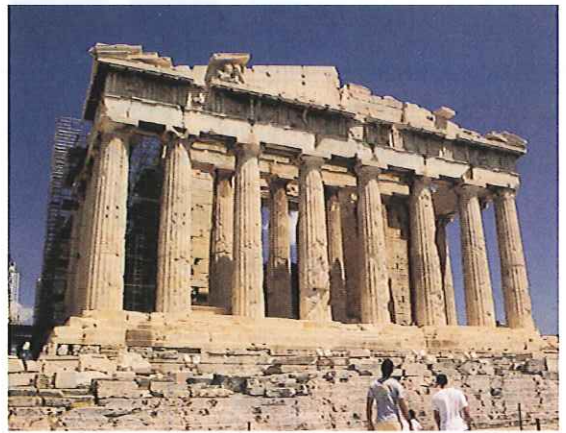
アテネの象徴ともいえるパルテノン神殿