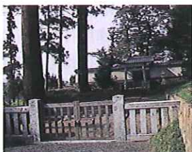
後鳥羽上皇の遺灰と遺骨の一部が埋葬された御火葬塚